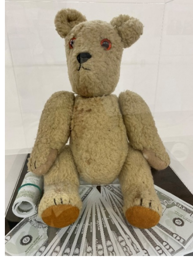
2. カリコー博士が渡米の際に紙幣を忍ばせた テディベア（レプリカ）