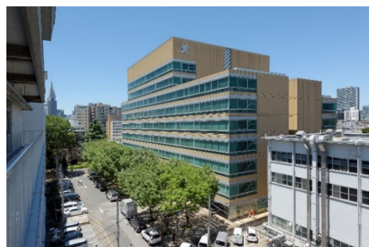
総合医科学研究棟外観