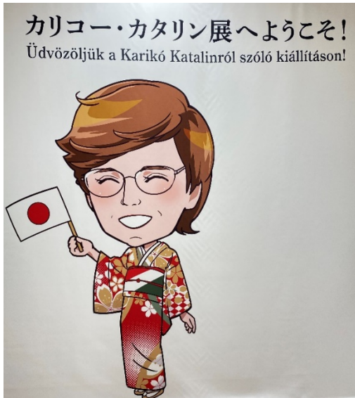
1. 等身大のカリコー博士が会場でお出迎え